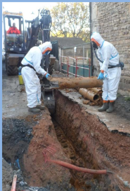
Retrait d'une section de canalisation rue de la Moinerie

Après une période intense de travaux, les derniers mois ont été plus calmes.